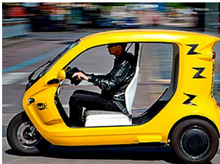
Bzzzt AB, eldrivna taxibilar i storstäder.