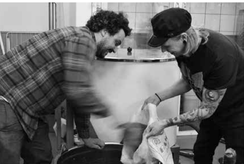
Kosters trädgårdar. Här slevas 50 kilo ekologisk malt som krossats för hand. Bilden är från föreningens hemsida.

I samarbete med BRG (Business Region Göteborg), Almi och Stiftelsen Kooperativt Nyföretagande har ett antal garantier samfinansierats med Mikrofonden Väst. En effektiv lösning för garantitagaren och en riskreducering för oss. Det gör att vi kan möta ett större finansieringsbehov än vi själva klarat av att lösa på egen hand. Dessutom ökar mängden kapital som allokeras till den sociala ekonomin vilken ökar tillgången till kapital i sektorn i stort.