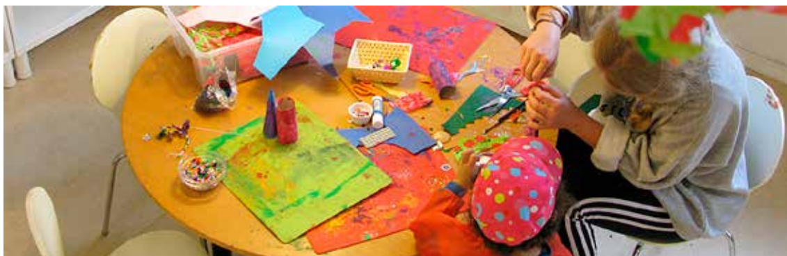
Montessoriskolan Vega ek för.

Totalt utstående garantier och investeringar 3 290 420 kr.