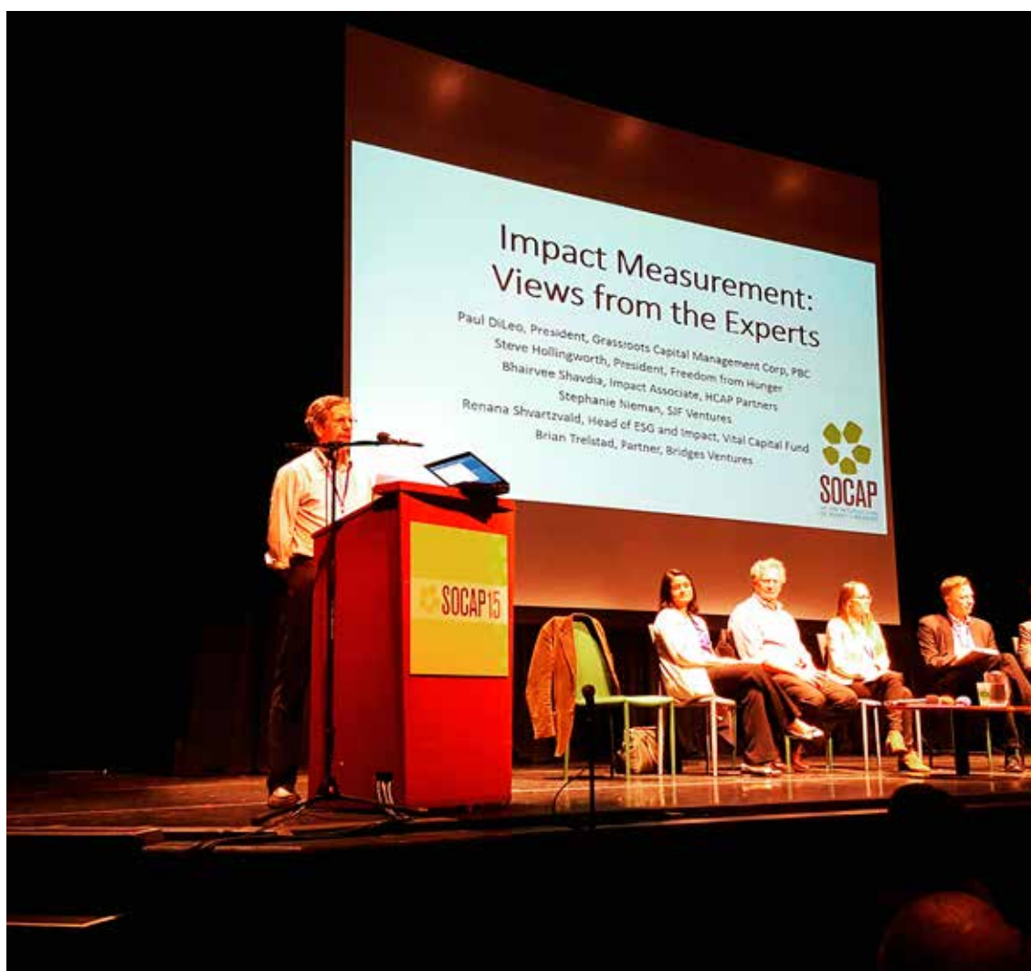
Social Capital Market.

2016 har varit ett år då vi fördjupat implementeringen av samarbetsavtalet med Business Region Göteborg, Göteborg Stad, där vi genom ett villkorat lån har 5 MSEK att ställa ut garantier för, samt erhållit driftsmedel. Dessa medel har givit ett viktigt tillskott för att kunna hjälpa fler verksamheter inom den sociala ekonomin och större garantibelopp. Vi har under 2016 nått ett mycket stort antal aktörer inom den sociala ekonomin men vi ser att vi behöver utveckla strategiska samarbeten och nätverk (t ex Mikrofonden nationellt) för att bli mer kända och nå fram bättre till våra målgrupper samt att vi behöver förstärka vår driftsbudget. Vi ser också att de verksamheter vi möter ofta behöver mycket stöd och ökad kunskap, t ex i ekonomi, och att det gör att det ofta tar lång tid innan de är redo för garanti eller investering.